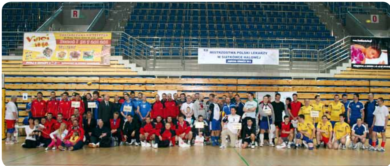
Uczestnicy XII Mistrzostw Polski Lekarzy w Siatkówce Halowej, 16-18.03.2012 r., Dąbrowa Górnicza.